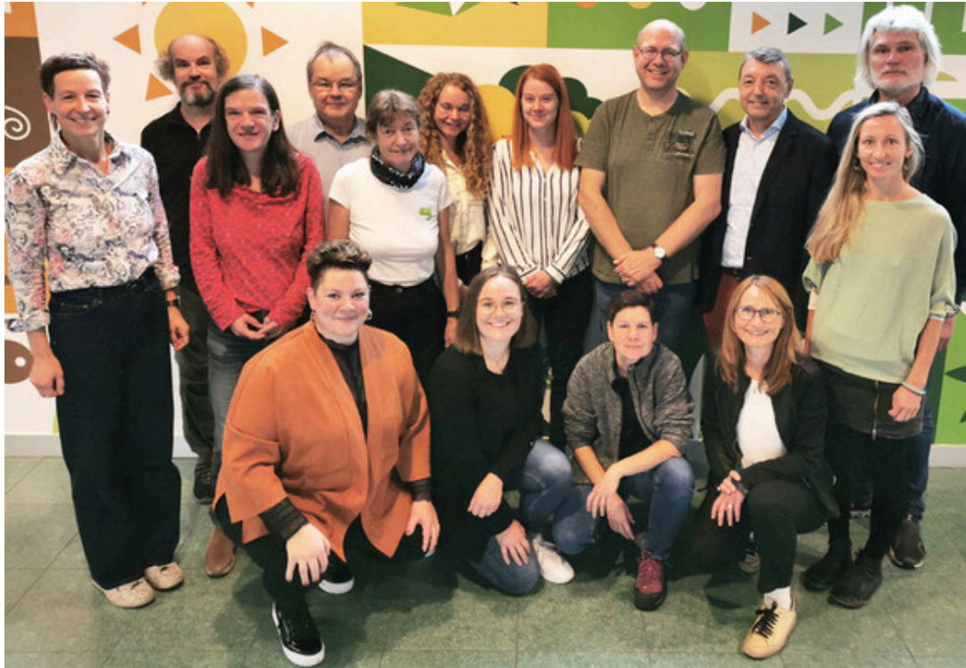
Das interdisziplinäre Projektteam von CLARC bestehend aus Vertreter*innen von FH JOANNEUM, Styria vitalis, Prime Mobility und der Radlobby ARGUS.