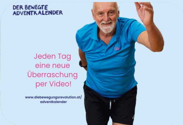
Videodreh für den bewegten Adventkalender