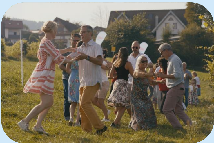
Salsatanzen in der Weststeiermark